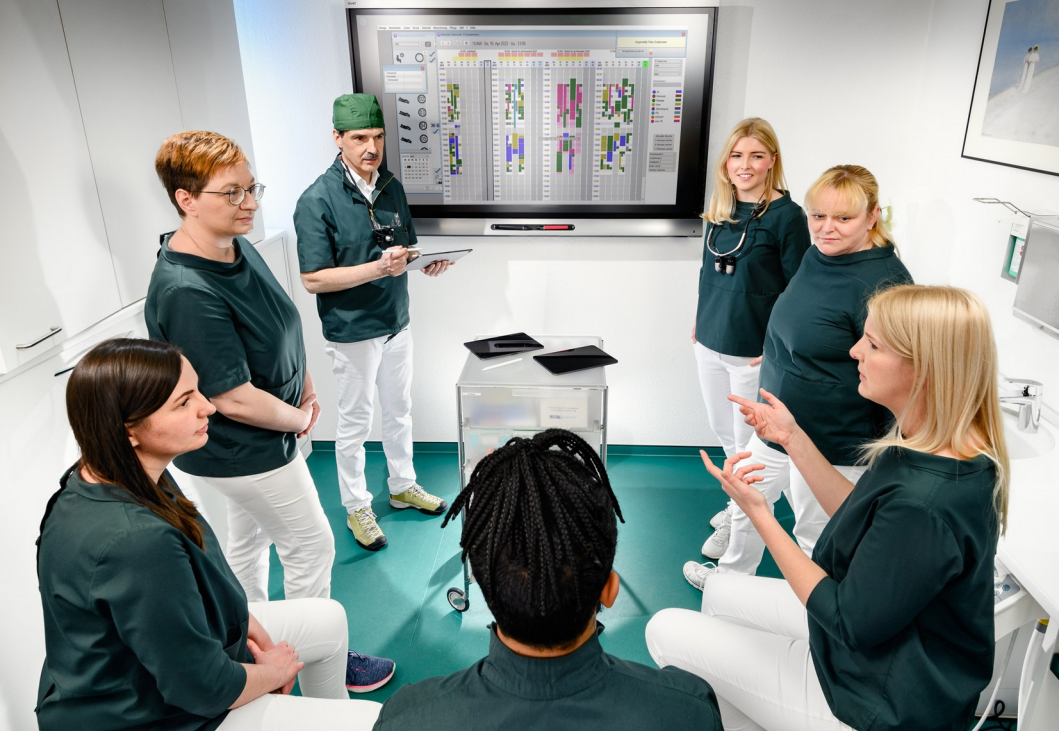
Gemeinsame Besprechung der Arbeitszeiten am Smartboard