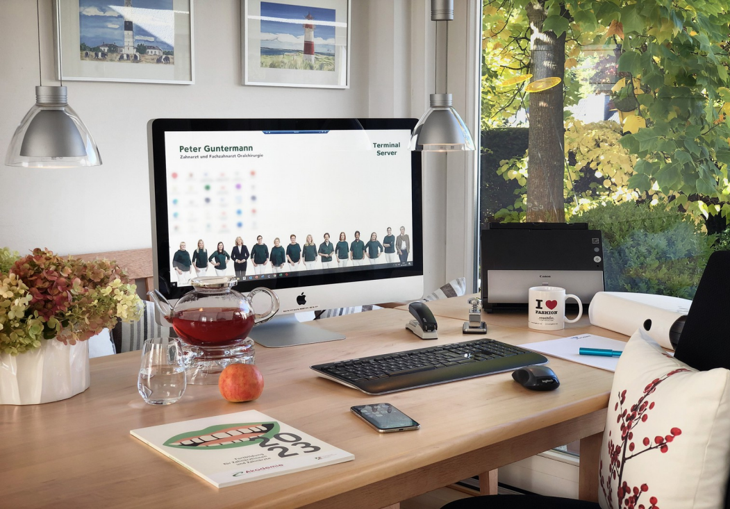
Home Office der Verwaltung